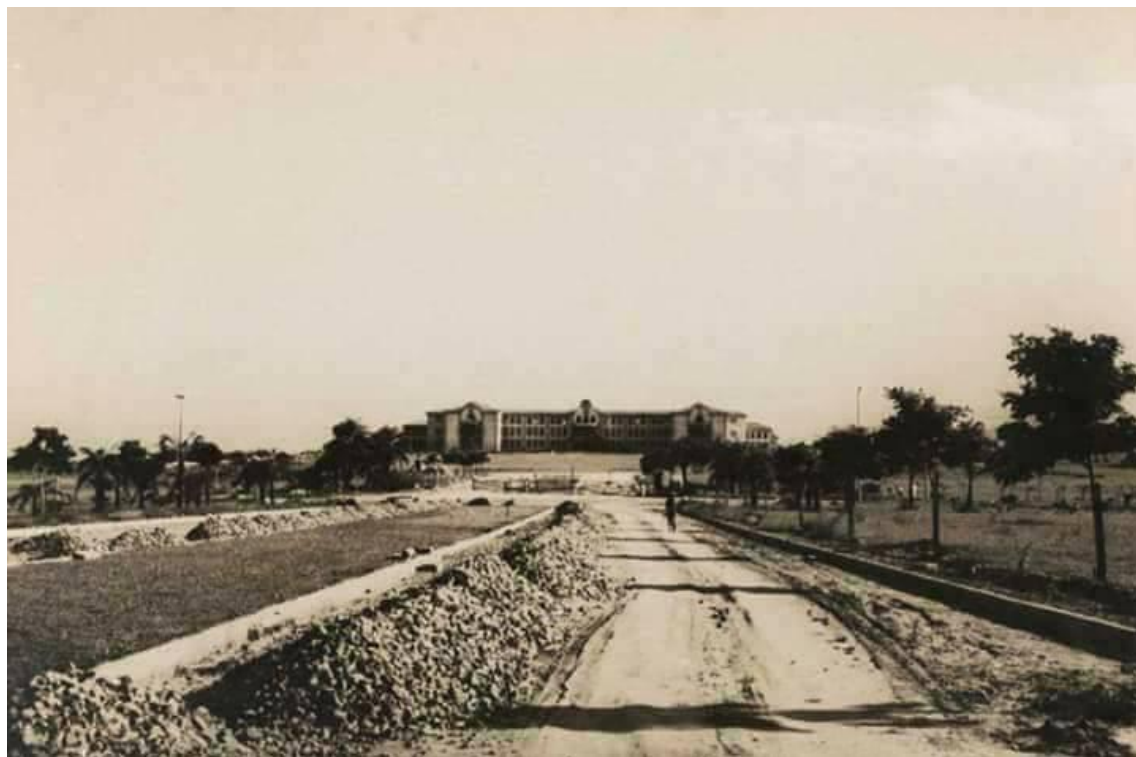
Figura 2. “Entrada do Câmpus Seropédica”, Itaguaí [RJ], [194?], [fotografia digitalizada]