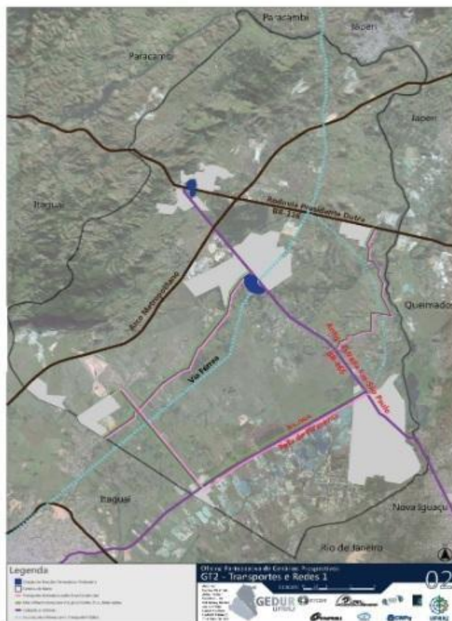
Mapa 1. Rodovias que interconectam Seropédica