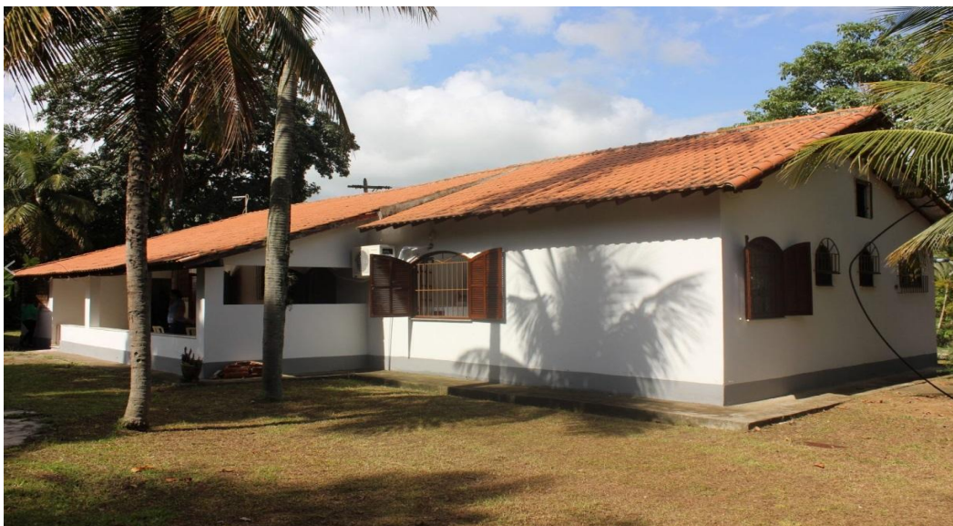
Figura 6. Inauguração da Casa de Hóspedes Professor Laerte Grisi, Seropédica [RJ], [2017], [fotografia digitalizada]