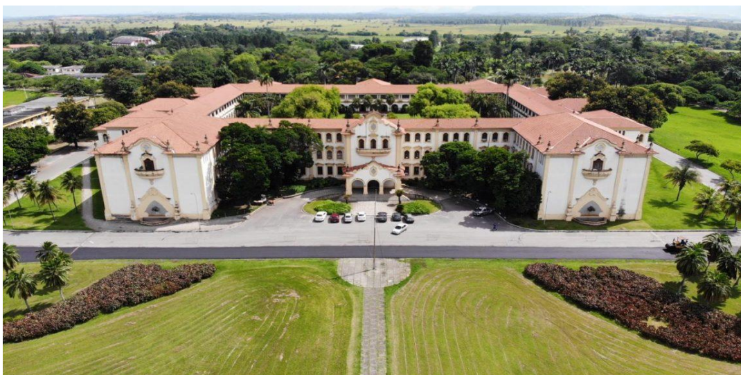
Figura 1. Campus Seropédica da UFRRJ, Seropédica [RJ], [2020], [fotografia digitalizada], fotógrafo desconhecido

Localizada no atual município de Seropédica, a UFRRJ possui um dos maiores campus universitários do mundo. Às margens da Rodovia Luiz Henrique Rezende de Novaes (BR 465), mais conhecida como Antiga Rio – São Paulo, seu Campus Sede se descortina em um cenário que destoa com a ocupação humana típica da Baixada Fluminense (ver Figura 3 1).