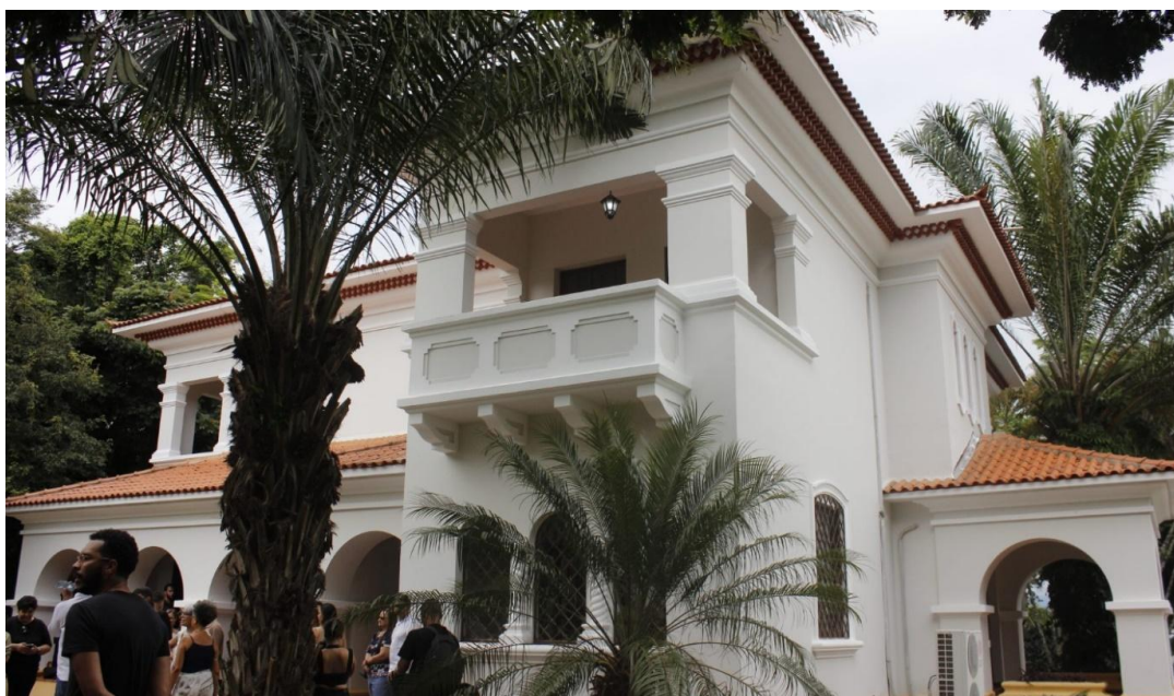
Figura 4. Inauguração do Museu Casa do Reitor – Centro de Memória da UFRRJ, Seropédica [RJ], [2023], [fotografia digitalizada]

O Núcleo de Práticas Jurídicas (NPJ), vinculado ao Curso de Direito do Campus Seropédica da UFRRJ, foi igualmente guarnecido em uma instalação de um PNR junto ao bairro da Ecologia, no fim do ano de 2018. Dentre os PNR com direcionamento cativo aos gestores da UFRRJ, destaca-se a Casa dedicada a quem ocupa a Reitoria (ver Figura 4).