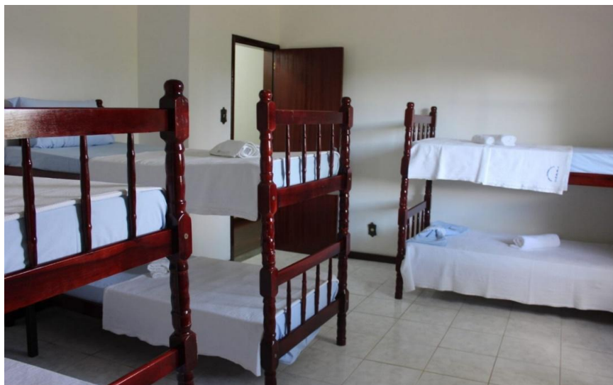
Figura 7. Quarto coletivo da Casa de Hóspedes Professor Laerte Grisi, Seropédica [RJ], [2017], [fotografia digitalizada], fotógrafo desconhecido

O desenvolvimento das atividades de diagnóstico e intervenção se baseou na compreensão da Casa de Hóspedes em analogia ao modelo Cama e Café. Este, por sua vez, pode ser compreendido como um “meio de hospedagem oferecido em residências, com no máximo três unidades habitacionais, para uso turístico, em que o dono more no local, com café da manhã e serviço de limpeza” (Brasil, 2010). Contando com a capacidade de acolher até 18 pessoas, a Casa de Hóspedes Professor Laerte Grisi detém quartos privativos e coletivos (ver Figura 7), sendo que estes últimos eram divididos por gênero.