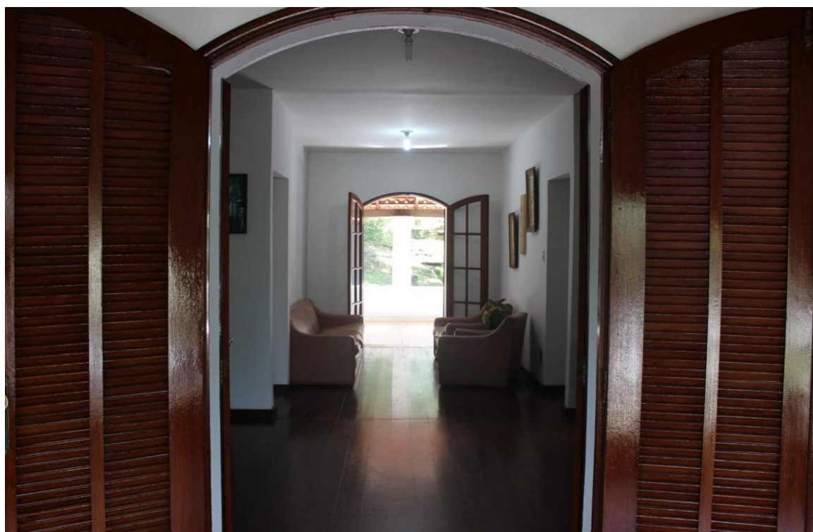
Figura 8. Porta Principal da Casa de Hóspedes Professor Laerte Grisi, Seropédica [RJ], [2017], [fotografia digitalizada]

Além de cozinha, sala de estar (ver Figura 8), varanda, área livre de edificações com jardim, lavanderia, a Casa de Hóspedes possui aparelhos de ar condicionado, ventiladores e acesso à internet. Localizada dentro do Bairro da Ecologia, o qual é de operacionalização da UFRRJ por deter um contingente importante de PNR, a Casa tem fácil acesso à BR 465.