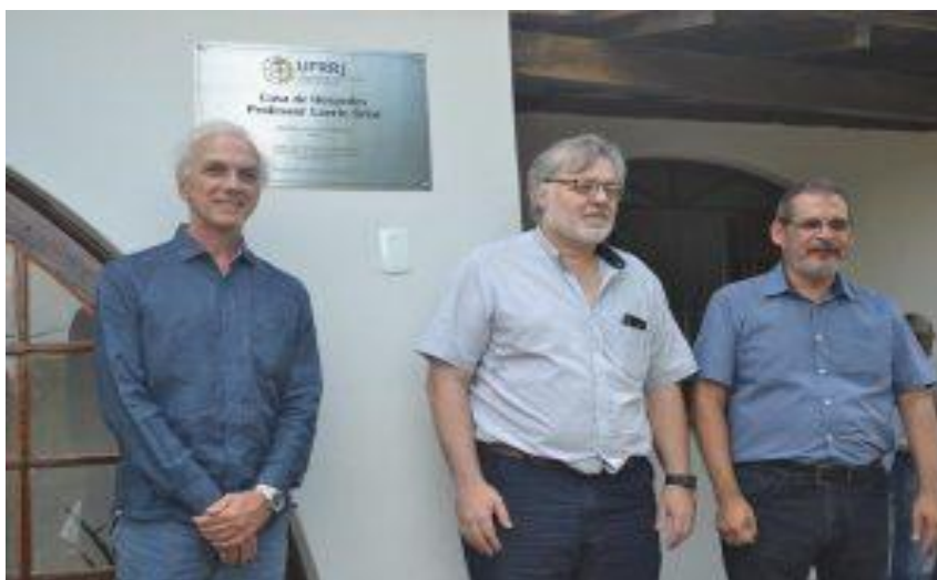
Figura 5. Inauguração da Casa de Hóspedes Professor Laerte Grisi, Seropédica [RJ], [2017], [fotografia digitalizada]

Assim, o Centro de Memória da UFRRJ, além de ter nova sede, passou a reconfigurar o uso desse PNR, outrora particular a quem ocupasse o cargo de reitoria da UFRRJ. O mesmo ocorreu com a Casa de Hóspedes Professor Laerte Grisi. Enquanto parceria entre a CORIN e a Reitoria, o Próprio Nacional Residencial foi reconfigurado em seu uso original para atender ao Programa de Internacionalização da UFRRJ, sendo inaugurado em no dia 29 de novembro de 2017 (ver Figura 5).