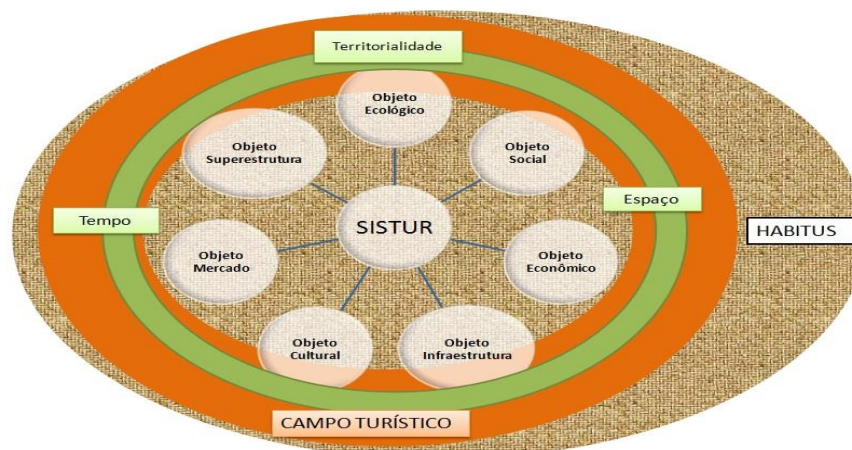
Figura 1: Fluxograma do Campo Turístico

O Turismo deve ser entendido em sua complexidade como um sistema orgânico, aberto que estabelece relação direta e indireta com diversos objetos: econômico, social, cultural, ambiental expressos por fazeres empíricos tais como: comércio, lazer, eventos, entretenimento, animação cultural, gastronomia, hospedagem, esporte, transporte, saúde, seja em ambientes urbanos, rurais ou de natureza preservada. Necessita de uma apropriação teórica, a qual só é estabelecida pela pesquisa, um conhecimento produzido para além da sua aparência, da película lustrosa da superfície , a exemplo do fluxograma na figura 1 abaixo: